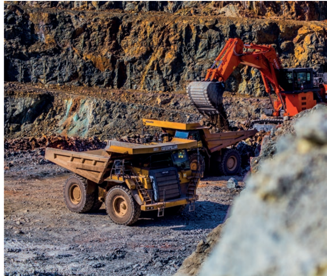
Trabajos en la mina de Río Tinto, explotada por Atalaya Mining.

Otro ejemplo de compañía claramente infravalorada por el mercado y de la que hemos hablado poco es Wilhelmsen (WWI) , conglomerado industrial noruego, controlado por la familia Wilhelmsen (5ª generación) con negocios con posiciones líderes en sus segmentos. Tiene una capitalización de 700mn€, caja neta y la compañía ha